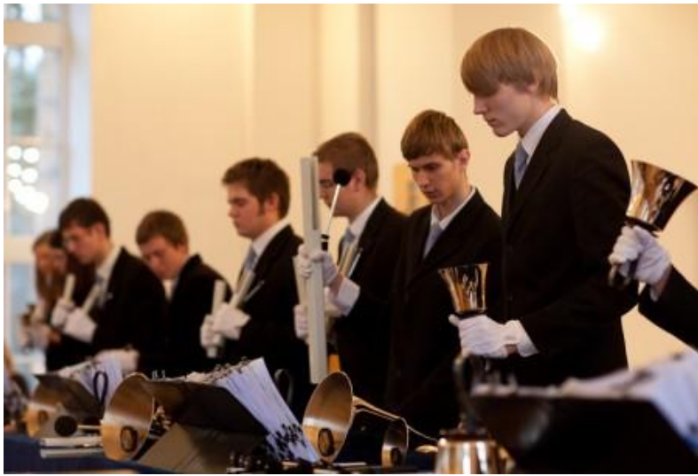
Zvanu ansamblis „Slokas zvani” Ikšķiles baznīcā (06.12.2009).